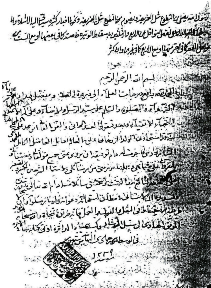
صورة إجازته للملا محمد تقي الشاهرودي

«لا إله إلا الله الملك الحق المبين، عليّ الطباطبائي»