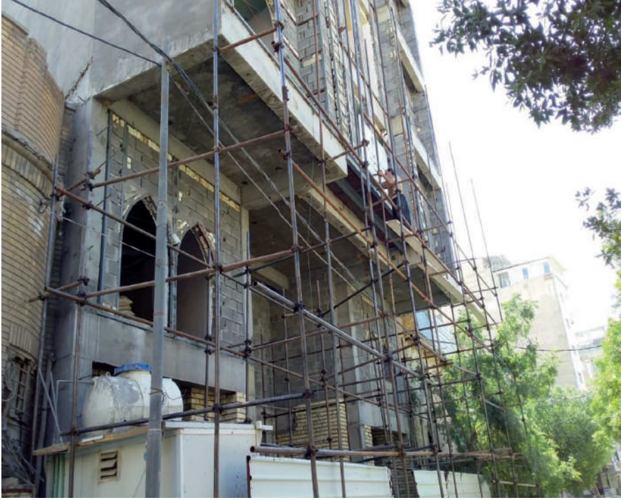
صورة واجهة البناية الجديدة للمدرسة المهديّة الدينية صوّرها الباحث بتاريخ ١٥ / ٧ / ٢٠١٩

السنة الثامنة / المجلد الثامن / العدد الثالث والرابع (٢٠١٩-٢٠٢٠) شهر جمادى الأولى ١٤٤٣ هـ / كانون الأول ٢٠٢١ م