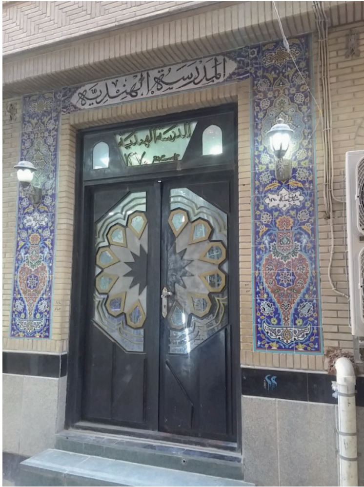
ملحق (٤) الباب الرئيس للمدرسة عام ٢٠١٩م (٧٣)