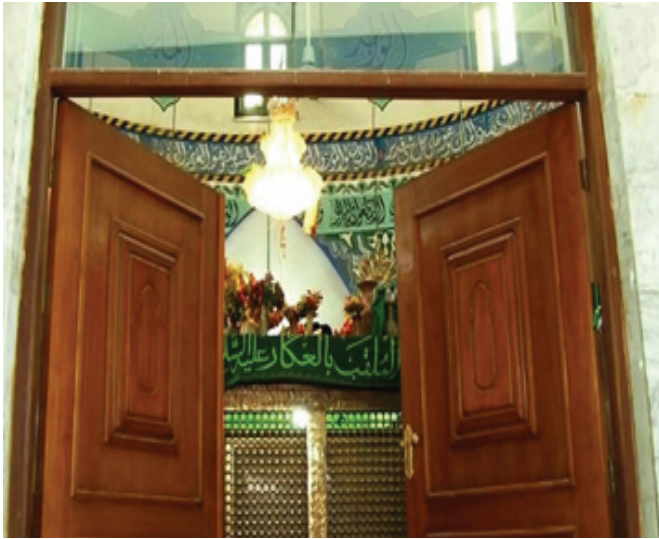
صورة مرقد محمد بن إبراهيم المصطفى