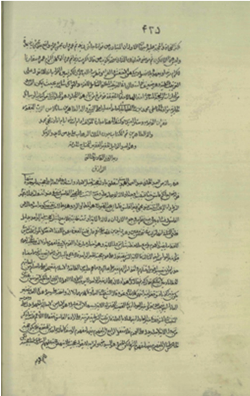
الورقة الأولى من النسخة (أ)

شهر محرم الحرام ١٤٤١ هـ / أيلول ٢٠١٩ م السنة السادسة / المجلد السادس / العدد الثالث (٢١)