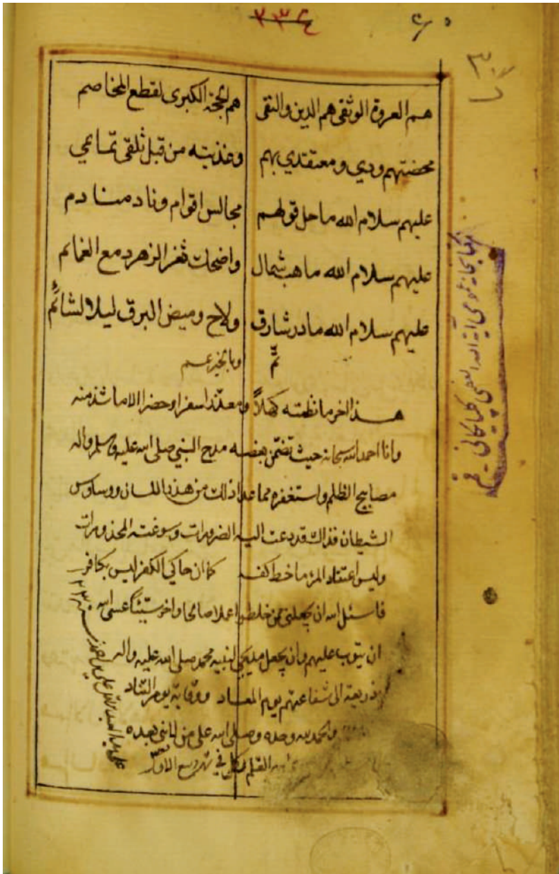
الورقة الأخيرة للمخطوطة من النسخة (أ)