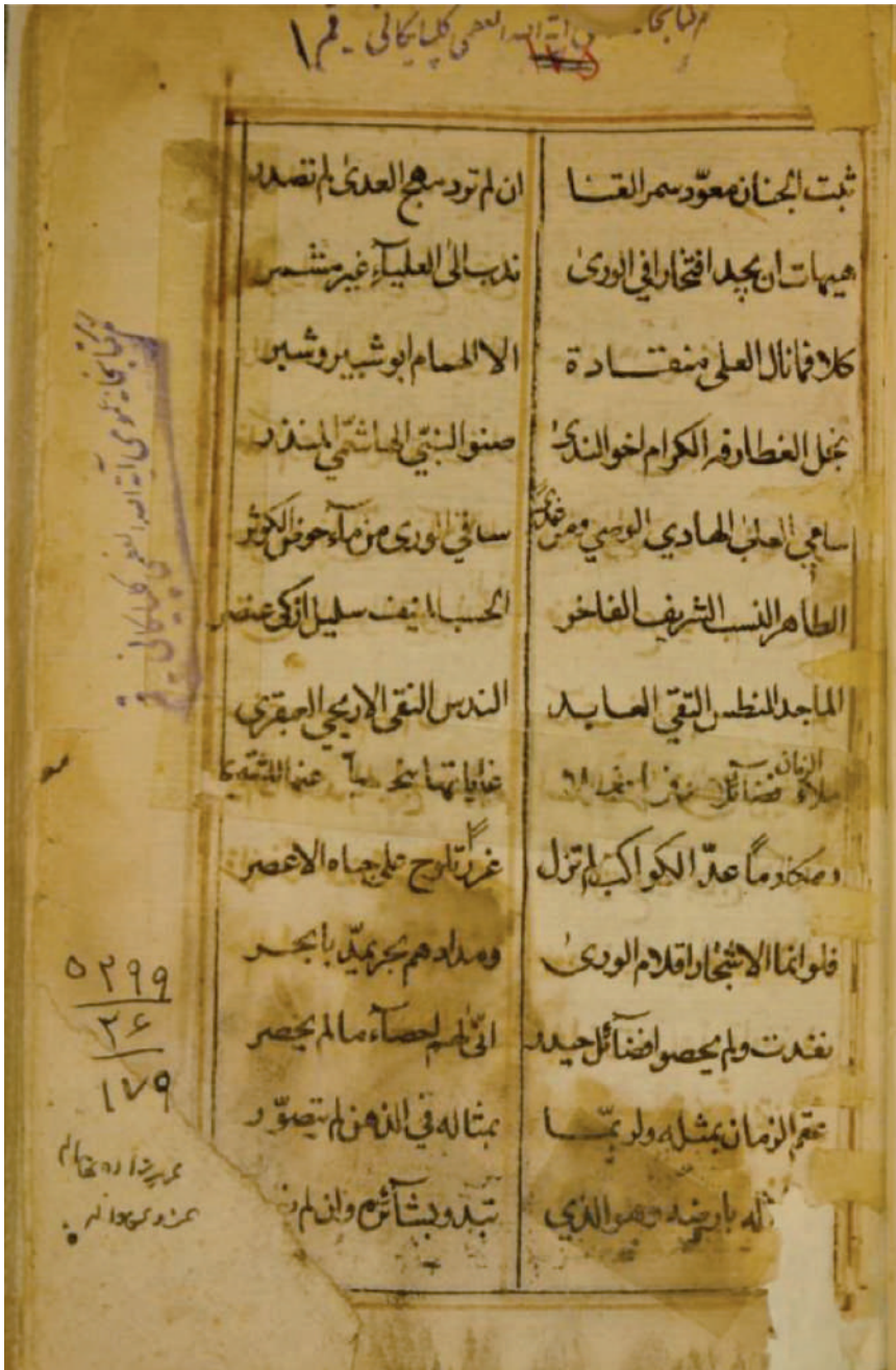
الورقة الأولى للمخطوطة من النسخة (أ)

السنة الثامنة / المجلد الثامن / العدد الثالث والرابع (٢٩-٣٠) شهر جمادى الأولى ١٤٤٣ هـ / كانون الأول ٢٠٢١ م